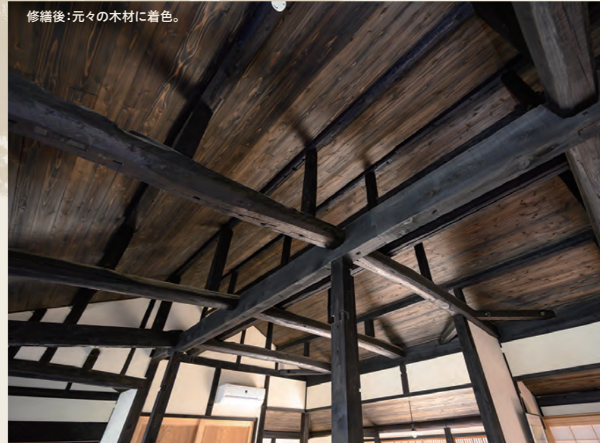
修繕後:元々の木材に着色。