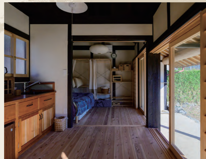
修繕後:社員の宿泊棟として使用。

この日の取材の様子はこちらから YouTubeチャンネル 森林環境情報誌 もりりん