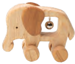
ノシノシバオーン 「ぞう」

動かすたびにチャラン♪4種類の動物をモチーフにした転がし遊びのおもちゃです。真ん中には優しい音色のオルゴールボール(鈴)がついて、振ると心地いい音が響きます。