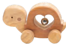
のんびりすすもう 「かめ」

サイズ：W120～140mm×H85～115mm×D65～75mm 材質：ヒノキ・ケヤキ