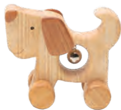
ワンワンはしるよ 「いぬ」