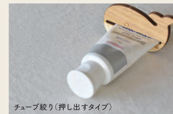
チューブ絞り(押し出すタイプ)