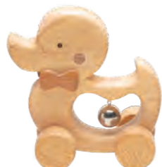
おしゃれにおさんぽ 「あひる」